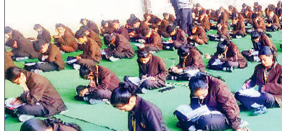
गोहाना। परीक्षा देते परीक्षार्थी।