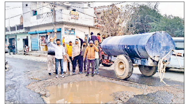
गन्जौर। पेयजल आपूर्ति लाइन को ठीक करने के बाद उखाड़ी गई सड़क को ठीक न किए जाने पर रोष जताते स्थानीय लोग।

कर पाइपलाइन तो ठीक कर दी गई। को दुरुस्त करना उचित नहीं समझा है। कई महीने बाद भी विभाग द्वारा