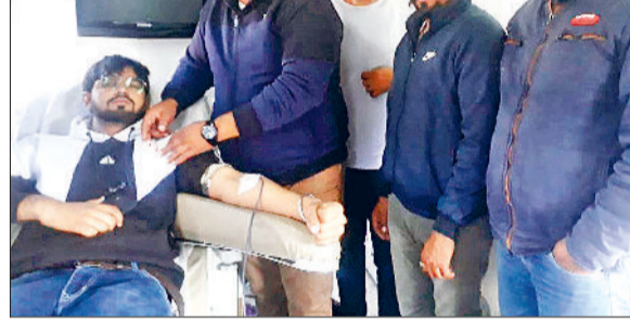
गोहाना। रक्तदाताओं का हाँसला बढ़ाते अतिथि।