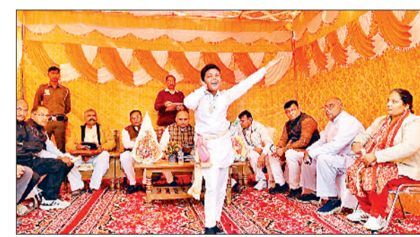
सोनीपत। कार्यक्रम में प्रस्तुति देते बच्चों को अनेक घर द्वार पर सभी प्रकार की समस्याओं का निवारण मिल रहा है।