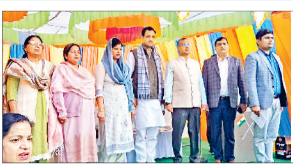
गोहाना। भारत को विकसित राष्ट्र बनाने का संकल्प दिलाते अतिथि।

यात्रा प्रदेश में आगामी 26 जनवरी तक चलेगी। चेयरपर्सन ने कहा कि गरीब लोग धन के अभाव में उपचार से वंचित न रहें, इसके लिए आयुष्मान भारत-चिरायु योजना चलाई जा रही है। इसमें अंत्योदय परिवार को 5 लाख तक का मुफ्त इलाज उपलब्ध कराया जाता है। परिवार पहचान पत्र के माध्यम से सरकारी सेवाओं और योजनाओं को ऑनलाइन कर देने से इनका लाभ पात्र लोगों को घर-द्वार पर ही मिल रहा है। इस दौरान बैंक की स्टॉल, स्वास्थ्य जांच शिविर, हेल्प डेस्क, आयुष कैंप, योगाभ्यास, क्रिड हेल्प डेस्क, सीएससी स्टाल, पीएम उज्ज्वला योजना, मेरा भारत पंजीकरण हेल्प डेस्क, एक्स सर्विस मेन व सर्विस मेन के लिए हेल्प डेस्क भी लगाई गईं।