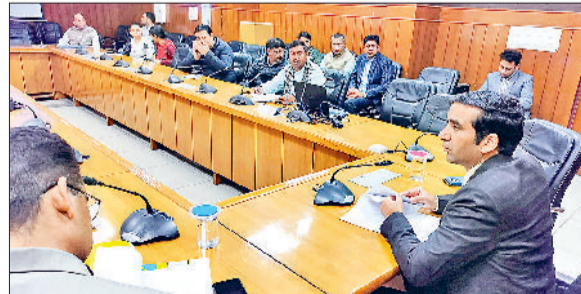
सोनीपत। बैठक के दौरान मौजूद अधिकारी।